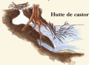
Hutte de castor